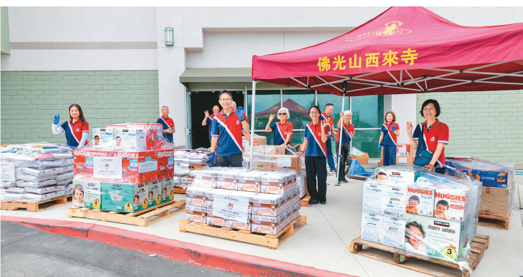
↑洛杉磯佛光人集體創作，將援助物資準備就緒，捐助給軍人家庭。

【人間社記者潘青霞洛杉磯報導】佛光山西來寺與國際佛光會洛杉磯協會得知慈善團體Making Spirits Bright舉辦「捐助軍人家庭」（Feeding Military Families）物資募捐活動，主動表達參與意願。歷經7周