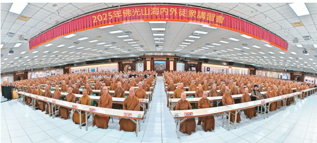
↑「佛光山2025年海內外徒眾講習會」9月14日至19日雲居樓舉行，全球徒眾齊聚，探討今年主題「人間佛教的繼往開來」。

各項證照考取包括茶葉感官品評、急救、溫室氣體盤查標準內部查證員、社會工作師、能源管理、高空作業車、淨零碳規