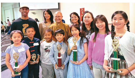
↑得獎學生合影。

【人間社記者周芝含洛杉磯報導】美國南加州中文學校聯合會5月18日於洛杉磯華僑文教服務中心大禮堂，舉行春季學術比賽頒獎典禮，佛光西來學校共有7名學生在激烈競爭中脫穎而出，榮獲多項佳績，充分展現兩個月來勤奮練習的成果與堅強實力。 自2月22日起，西來學校爲20名學生展開密集訓練，歷經校內初賽選拔及多次訓練，最終於4月13日前往Arcadia High