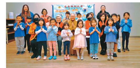
↑春季學術初賽詩詞朗誦幼稚組及初小組合影。

【人間社記者周芝含洛杉磯報導】美國南加州中文學校聯合會5月18日於洛杉磯華僑文教服務中心大禮堂，舉行春季學術比賽頒獎典禮，佛光西來學校共有7名學生在激烈競爭中脫穎而出，榮獲多項佳績，充分展現兩個月來勤奮練習的成果與堅強實力。 自2月22日起，西來學校爲20名學生展開密集訓練，歷經校內初賽選拔及多次訓練，最終於4月13日前往Arcadia High