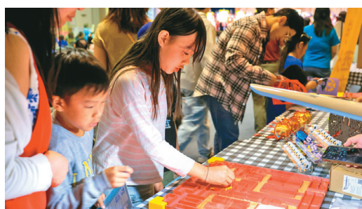
↑蛇字迷宮寓教於樂，吸引孩子一再挑戰。