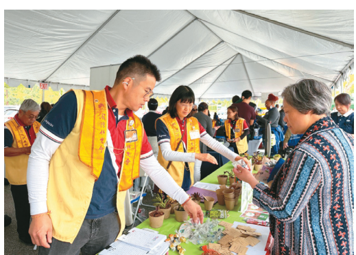
↑洛杉磯協會攤位提供蔬菜種子、「三好多肉植物」與民眾結緣。