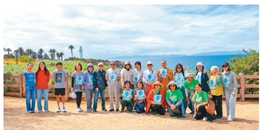
↑南灣一、二分會4月12日率先於Point Vicente Lighthouse開跑。

【人間社記者心禹洛杉磯報導】國際佛光會洛杉磯協會25個分會、佛光青年一團，4月12日至19日於大洛杉磯地區12個場地舉辦VEGRUN，並獲西來大學、佛光西來學校、佛光西來童軍團及三好學園響應。逾650人參與，年齡從1歲至92歲，累積里程超過658英里。活動有健走、八段錦、易筋經、戶外禪、太極、採橘、自行車等形式，並完成GPS軌跡有機愛心圖樣，象徵眾人以腳步與願心連結。