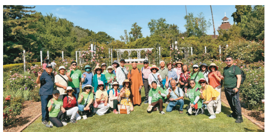
↑哈崗與白塔二分會於阿卡迪亞洛杉磯縣立植物園「孔雀園」健走。

【人間社記者心禹洛杉磯報導】國際佛光會洛杉磯協會25個分會、佛光青年一團，4月12日至19日於大洛杉磯地區12個場地舉辦VEGRUN，並獲西來大學、佛光西來學校、佛光西來童軍團及三好學園響應。逾650人參與，年齡從1歲至92歲，累積里程超過658英里。活動有健走、八段錦、易筋經、戶外禪、太極、採橘、自行車等形式，並完成GPS軌跡有機愛心圖樣，象徵眾人以腳步與願心連結。