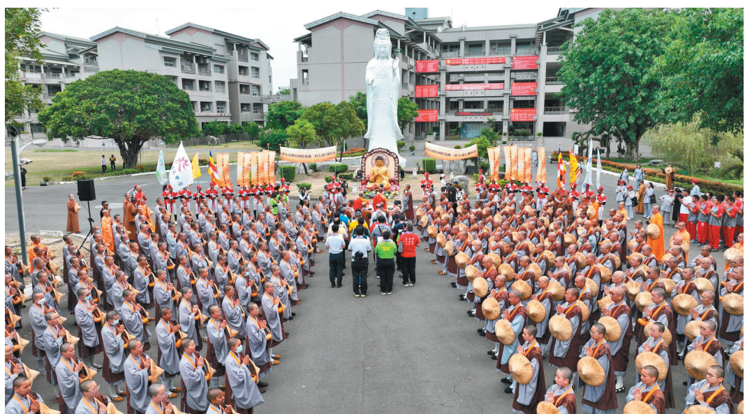
↑托鉢隊伍在佛光山普門中學集合，返回佛光山。

下午的南台灣烈日高照，行腳僧頭戴斗笠，從普中出發，綿延數公里的祈福隊伍穿越社區街道，信眾設香案祈福，虔誠祝禱，民眾把握難得因緣布施植福、祈求平安吉祥；其中更有拄著拐杖、坐著輪椅的長輩歡喜供養，讓整條行腳路線瀰漫著溫馨、祥和的氛圍。適逢母親節，不少子女特地陪伴母親與長輩投鉢布施。