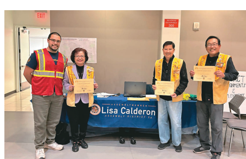
每位義工皆獲贈感謝狀。

說明會結束後，義工分組開車駛入黑夜，秉持「尊重與不驚擾」的安全原則，依照分配區域並搭配路線APP，力求數據準確。義工在街道、公園、停車場、橋下等