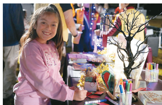
↑ 許願樹上掛著孩童的期望，掛上卡片的孩童眼裡閃著光。

慧澄法師表示，佛光山開山祖師星雲大師提倡「環保與心保」，因此西來寺攤位內容包括推廣蔬食A計劃、贈送蔬菜種子，並設計多項互動遊戲，如地球日趣味知識轉盤、地球日單字尋寶，以及「紙上三好正念迷宮」。