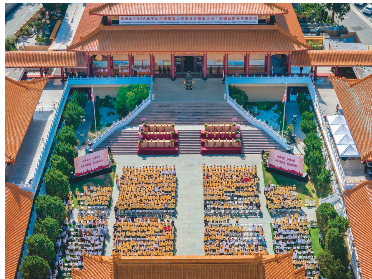
↑ 北美洲30座道場、26個協會、逾1600名信眾齊聚西來寺大雄寶殿及成佛大道，場面莊嚴隆重。

【人間社記者潘青霞洛杉磯報導】佛光山西來寺是佛光山開山祖師星雲大師自台灣邁向國際，在海外創建的首座道場。時值大師圓寂3周年，靈骨分燈五大洲12處道場，西來寺住持慧東法師率北美洲國際佛光會各協會代表、信徒與法師等84人專程返台，在3月19日迎奉、3月21日回到西來寺，舉行恭奉典禮以及「憶師恩讚頌會」，深具歷史意義。當地30座道場、26個協會、近2000名信眾齊聚恭迎，場面莊嚴隆重。