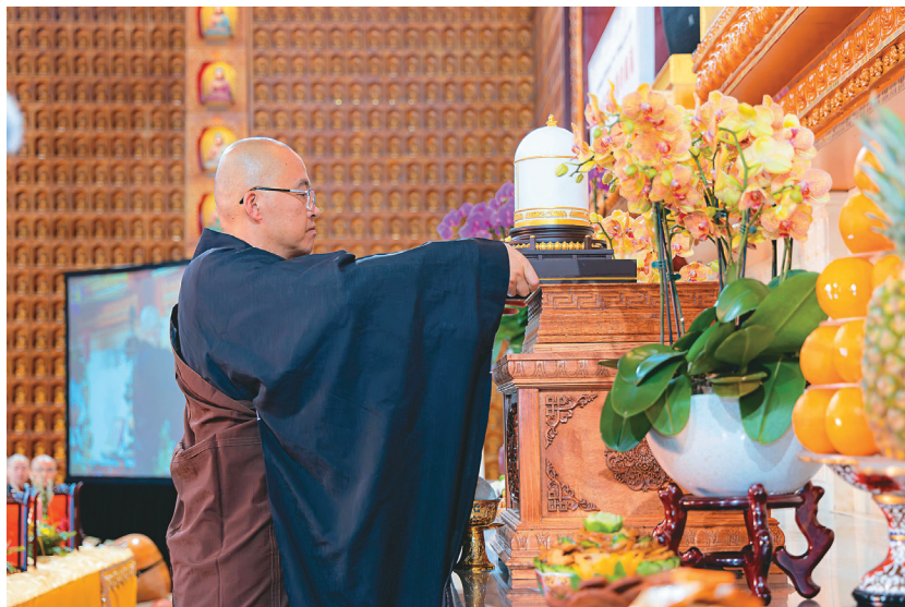
↑ 慧東法師恭敬地將佛光山開山祖師星雲大師靈骨，暫奉西來寺大雄寶殿。