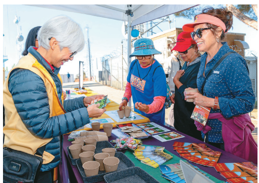
↑ 與會本土民眾對西來寺贈送的蔬菜種子充滿興趣。