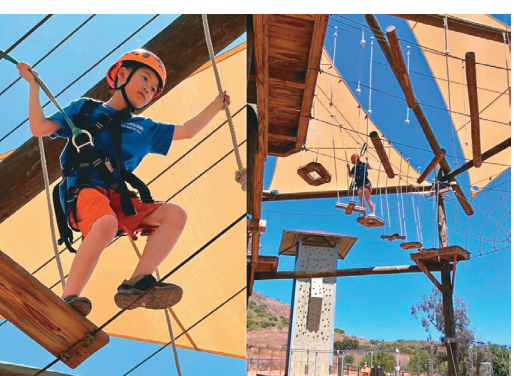
↑童軍和家長們在酷熱的天氣下，共進行5個培訓課程。