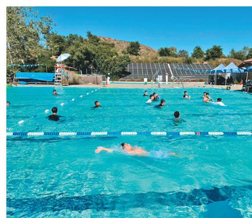
↑最後一個項目是水上活動，經過一天的勞累，童軍們換上泳衣奔向泳池。

第2階段為射擊和射箭，教練講解使用方法和安全措施，然後開始練習。很多童軍已有射擊經驗，尤其大童軍，表現出色，教練將打靶的成績紙送給他們作紀念。