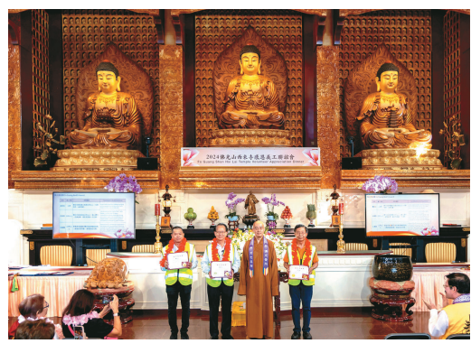
↑住持慧東法師頒發「佛光菩提獎」，受獎者為交通組義工3人。

【人間社記者郭昭華洛杉磯報導】佛光山西來寺6月29日於大雄寶殿舉行2024感恩義工聯誼會，感謝來自各單位500位義工平日的服務奉獻。活動包含頒獎典禮、祈願祝禱、餐會宴席、活動表演、抽獎等豐富內容。在西來寺建寺35周年之際，尤其是在睽違8年的水陸法會後舉行義工聯誼，深具意義。首先播放佛光山開山祖師星雲大師視頻開示，佛門裡的義工是自願發心來為大眾服務、為佛菩薩效勞，這才是真正的義工。佛光山住持心保和尚視頻開示，義工在佛門裡，就是「菩薩」，行的就是菩薩道。佛光山傳燈會會長慈容法師也以視頻，鼓勵大家發心工作要面帶笑容。